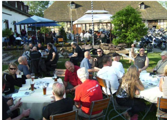
Søndag flød eftermiddagskaffen stille og roligt over i velsmagende fadøl. Man er vel på ferie.