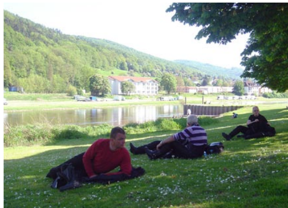
Sidste stop inden ankomst til Schloss Tonenburg. Pause ved bredden af Weserfloden i landsbyen Bodenwerder.