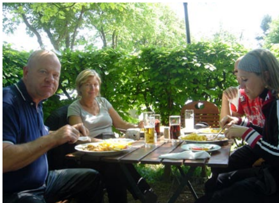
På turen mod Schloss Tonenburg blev der holdt ind ved restaurant Alten's Ruh nær Wunstorf. De kæmpestore schnitzler i champignonsauce med sprøde pomfritter blev spist med velbehag i det varme forårsvejr.