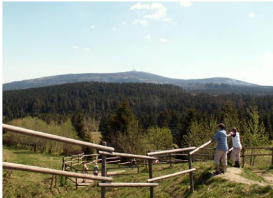
Harzen er et naturskønt område. Udsigten er især imponerende ved nationalparken Altenau-Torfhaus.