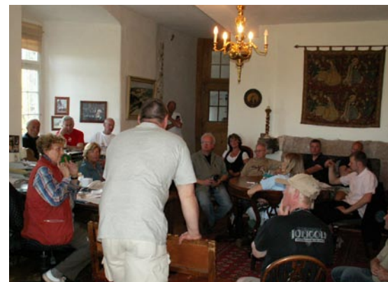
Mange lyttede interesseret til indehaverens (nederst til venstre) historiske foredrag lørdag aften, mens Kent fra Fyn (med ryggen til) oversatte til dansk.

På den anden side af floden lå restaurant Zum Ancher. Duften af grillet kød ramte vores næser, og i baggården var grillmeesteren i fuld sving. Jeg gnaskede i alt fra tykke tyske pølser til frisk salat, og efter at have proppet mig med god mad trængte min runde mave til afslapning. Jeg kunne lige overkomme at vandre de 20 meter ned til flodbredden for blot at slænge mig i solen sammen med min hustru. "Her-