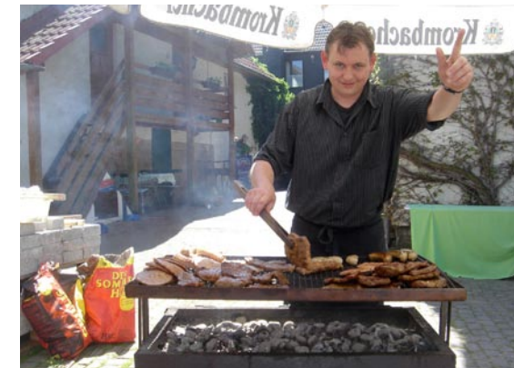
Grill-frokost ved Weser-floden. Her har vi Grillmeister nummer eins.