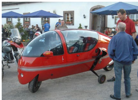
Alle, og ikke mindst Otto og Henrik, var meget betaget af den opsigtsvækkende 90'er maskine med støttehjul – BMW Ecomobile.

Turen fortsatte mod Lipoldsborg, hvor der var planlagt frokost. Vejene var pragtfulde og vejret ligeså. Undervejs skulle