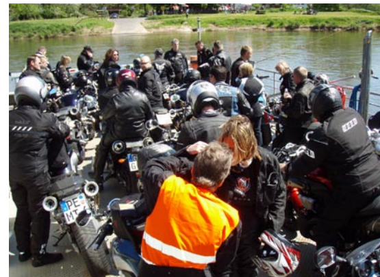
Der var 2-hjulet trængsel på den lille CO 2 -venlige færge over Weser-floden.