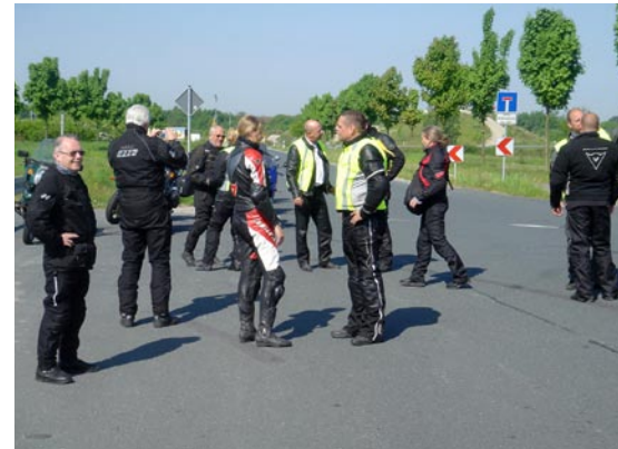
Ved motorvejsafkørslen i Hildesheim. Afsked med de andre rejseudtagere for at komme lidt hurtigere hjem.