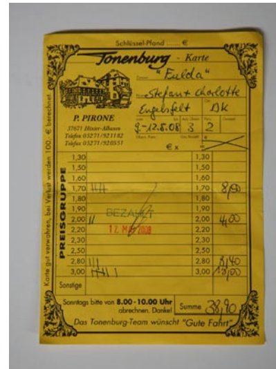
På afrejsedagen skulle drikke-regningen betales. Det gjaldt om at holde styr på den gule seddel. Mistede man den, blev man hele 100 € fattigere.