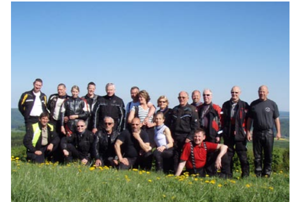
Deltagerne i turen. Tak for hyggelige stunder.